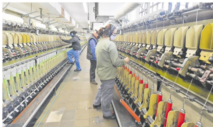
Les enquestes de l'informe trimestral es van realitzar entre el desembre del 2021 i el gener del 2022

Les expectatives empresarials de negoci per al total de sectors a Sabadell durant el primer trimestre del 2022 indiquen un manteniment de la situació, però sense tendències clares a la millora. El saldo del conjunt es redueix en -3,3 punts respecte de l'anterior i és de +8,2, conseqüència de la lleu disminució de respostes optimistes (-1,4 punts). Tot i això, les respostes que esperen mantenir l'activitat són el 55,8% del total i les que esperen augmentar-la són el 26,2%.